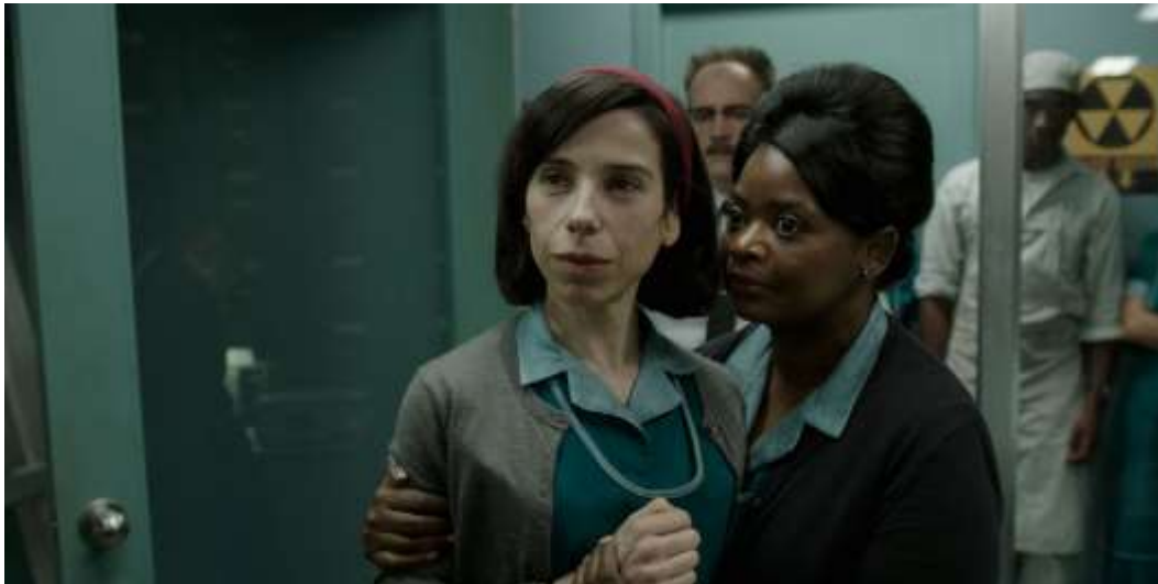
THE SHAPE OF WATER

À la soirée des Oscars MD , trois films réalisés en Ontario seront en compétition pour décrocher la statuette dorée convoitée dans le monde entier. Nous souhaitons bonne chance à toutes les personnes en lice le dimanche 4 mars! THE SHAPE OF WATER (LA FORME DE L'EAU) de Guillermo del Toro est en pole position avec 13 sélections, notamment dans les catégories Meilleur réalisateur et Meilleur film avec, dans ce dernier cas, un salut de la tête au producteur ontarien J. Miles Dale. Le long métrage d'animation soutenu par la SODIMO, THE BREADWINNER (PARVANA, UNE ENFANCE EN AFGHANISTAN) , coproduit par Anthony Leo et Andrew Rosen de la société ontarienne Aircraft Pictures, Angelina Jolie officiant en qualité de chef de production, est sélectionné dans la catégorie Meilleur film d'animation. Enfin, le scénariste et réalisateur Aaron Sorkin est sélectionné dans la catégorie Meilleur scénario adapté pour MOLLY'S GAME (LE JEU DE MOLLY) .